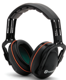
НАУШНИКИ ШУМОЗАЩИТНЫЕ С МЯГКИМ НАГОЛОВНИКОМ 505 66 53-04