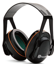
НАУШНИКИ ШУМОЗАЩИТНЫЕ 505 69 90-12